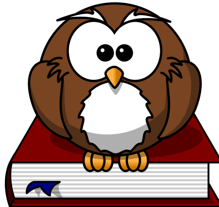
Obrázek 1 – Popis obrázku