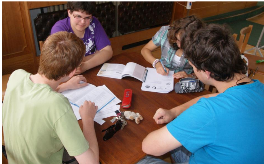
Práce s odbornou literaturou: vyplňování pracovních listů