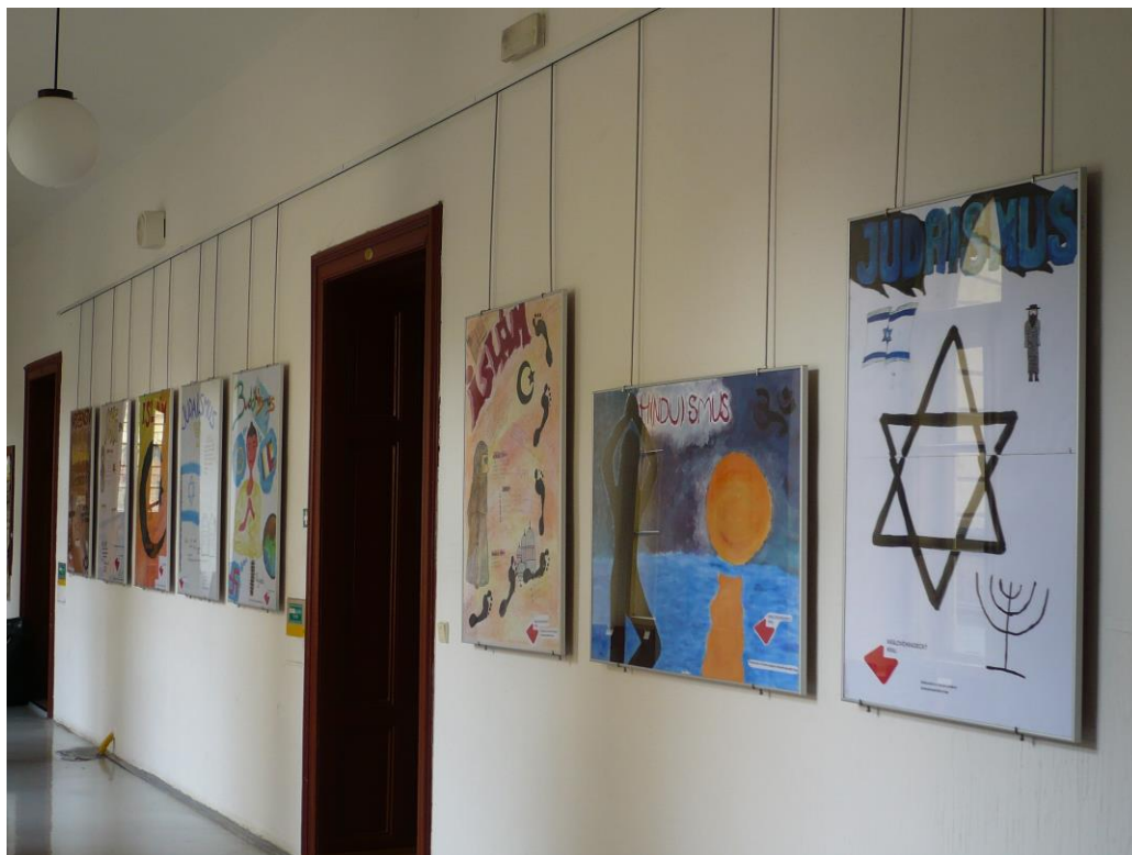
Výstup projektového dne: tematické nástěnky v alu rámech