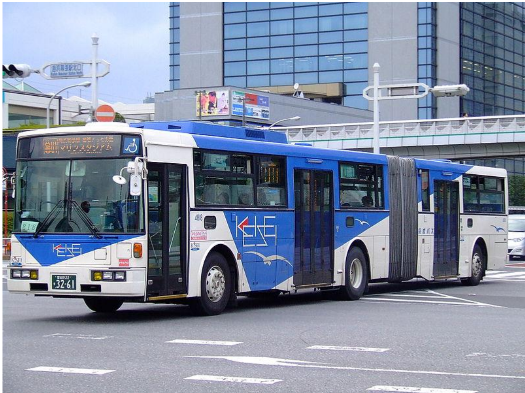
Obrázek 1: Autobus